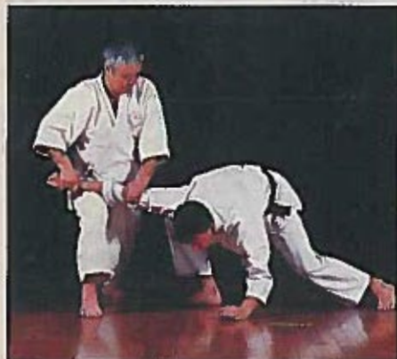
4. Il exerce ensuite une pression verticale sur le coude de son adversaire, en appuyant de tout son corps.