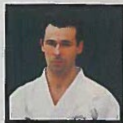
F. Vinot 4 e dan FFKAMA, et Wado-ryu Renmei