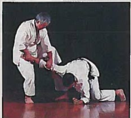
5. Tout en maintenant son avantage, il enjambe le bras immobilisé.