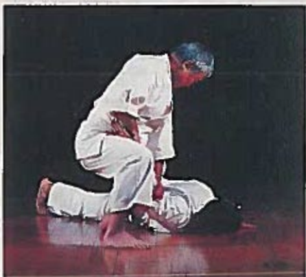
6. Il accentue son action de luxation au niveau du poignet, du coude et de l'épaule.